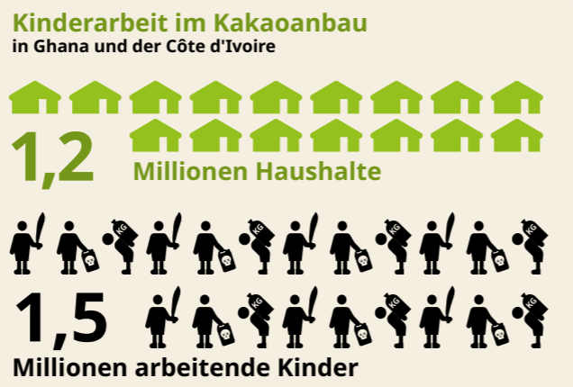
Quelle: NORC-Studie der University of Chicago, 2020

koladenindustrie damals, in den USA ein Gesetz zu verhindern, das Unternehmen verpflichtet hätte, Kinderarbeit im Kakaoanbau auszuschließen und ein Importverbot für Kakao aus Westafrika bedeutet hätte. Im September 2001 unterzeichneten stattdessen Vertreter der Schokoladenindustrie, darunter Mars und Nestlé, eine freiwillige Vereinbarung, die nach zwei US-Senatoren benannte Harkin-Engel-Protokoll . Darin versprachen die Unternehmen, die schlimmsten Formen der Kinderarbeit bis 2005 zu beenden. Dieses Ziel wurde nicht erreicht und in den Folgejahren mehrfach revidiert. Zuletzt strebte die Industrie an, die schlimmsten Formen von Kinderarbeit bis 2020 um 70 Prozent zu reduzieren. Doch auch dieses Ziel haben die Unternehmen verfehlt.