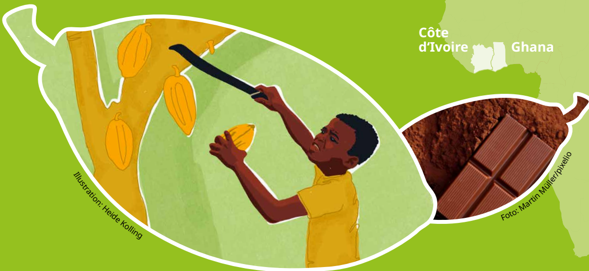
Illustration: Heide Kolling