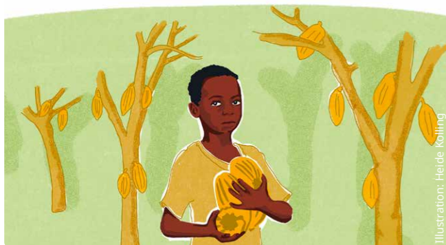
Viele Kinder arbeiten, weil das Geld für erwachsene Erntehelfer fehlt.