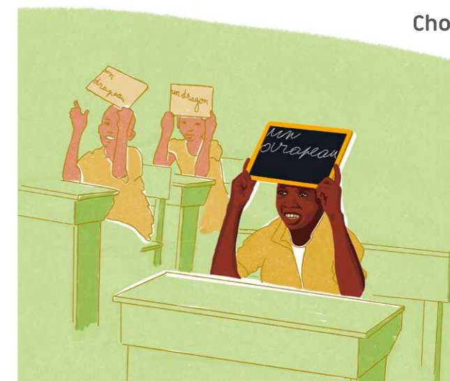
Gerade in der Erntezeit ist ein Schulbesuch für viele Kinder in Gefahr. Dorfschule im Distrikt Lagunes nahe Adzopé, Côte d'Ivoire (nachgezeichnet).

Eine typische Kakaobauernfamilie in Ghana mit etwa drei Hektar Anbaufläche und fünf Familienmitgliedern verdient umgerechnet 168 US-Dollar im Monat. Um ein existenzsicherndes Einkommen zu erreichen, welches die Grundbedürfnisse der Familien und die Kosten für den Kakaoanbau abdeckt, müssten es 360 US-Dollar sein – rund doppelt so viel. Existenzsicherndes Einkommen ermöglicht den Familien, sich nicht nur ausreichend und gesund zu ernähren, zu wohnen oder sich Kleidung zu kaufen. Es ermöglicht auch, Werkzeuge und Setzlinge zu kaufen oder Erntehelfer*innen zu bezahlen. Noch dramatischer sieht die Lage in der Côte d'Ivoire aus: Dort müsste sich das durchschnittliche Einkommen der Kakaobauernfamilien sogar verdreifachen. INKOTA fordert deshalb, dass Schokoladenunternehmen den Bauern und Bäuerinnen höhere Preise und Prämien zahlen, die ein existenzsicherndes Einkommen ermöglichen.